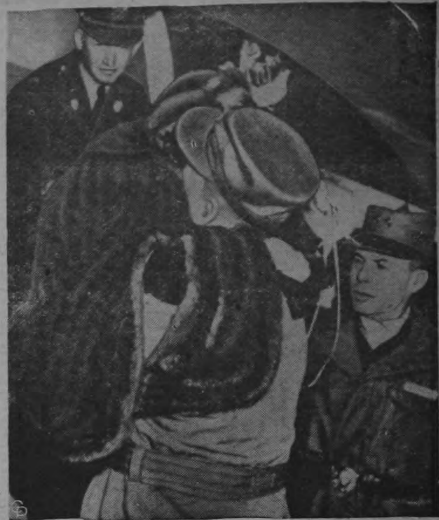
Después de 19 meses de separación, se encuentran, y estréchanse en cariñoso abrazo, el General James A. Van Fleet y su esposa, cuando ésta llega a Seoul a bordo del avión particular del General. Durante su permanencia en Corea del Sur, la señora será huésped del Presidente Syngman Rhee y de su esposa, en la capital coreana.

LONDRES, 25. INS.—La Reina Isábel II salió esta noche de Londres hacia Sandringham para atender a asuntos de negocios relacionados con aquella finca real